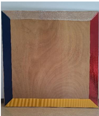
Resonanzplatte mit unterschiedlichen farblichen und taktilen Merkmalen.