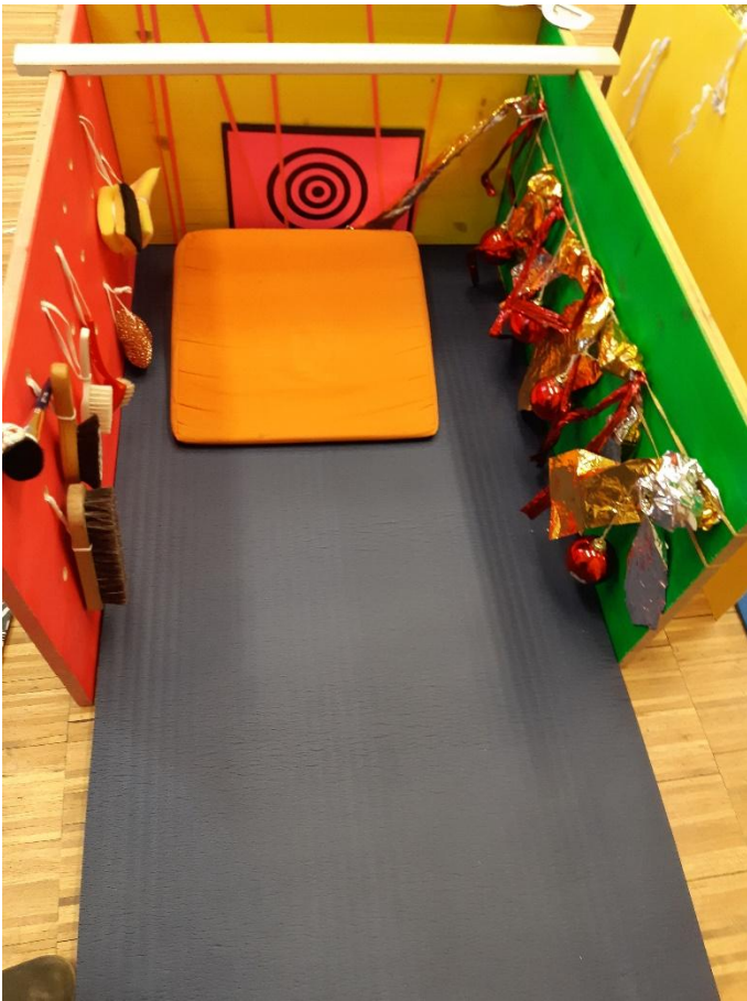
Eine Spielumrandung mit anregenden Materialien, auf jeder Seite ein anderes Thema.