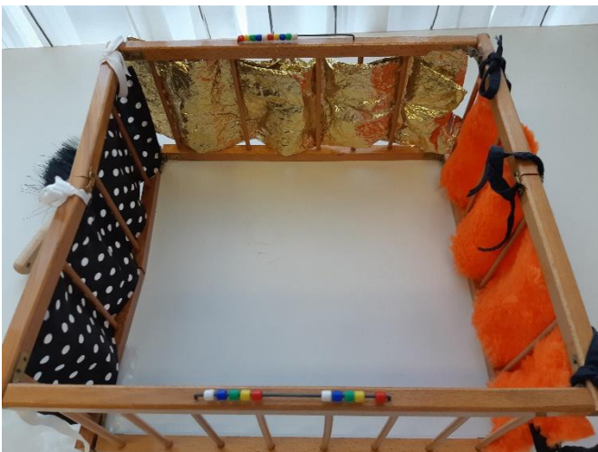
Ein Laufstall, bei dem jede Seite anders gestaltet ist