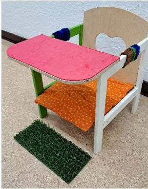
Ein Stuhl mit gestalteten Zonen: Arm- und Rückenlehnen, Sitzfläche, Tischplatte und Fußbereich.