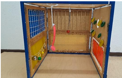
Ein „Kleiner Raum“ mit von der Decke hängenden Materialien zur Erkundung.

Mohr, Lars/Zündel, Matthias/Fröhlich, Andreas (Hrsg.) (2019). Sich Bewegen und den eigenen Körper spüren . In: Mohr, Lars/Zündel, Matthias/Fröhlich, Andreas (Hrsg.) (2019). Basale Stimulation. Das Handbuch . (1. Aufl.). Bern: Hogrefe. S. 149 - 156.